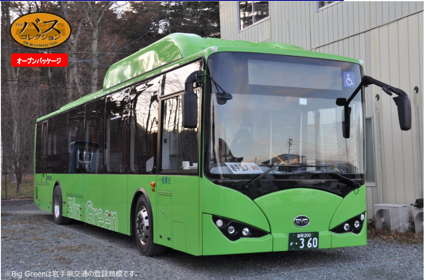
※Big Greenは岩手県交通の登録商標です。